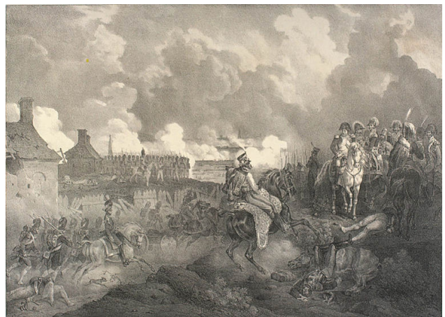
► Slag bij Bautzen

Inzoomen op de tekstafbeeldingen kan via heemkringokegem.be/lotelingen