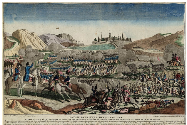
► Slag bij Bautzen